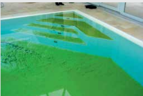
Schwimmbad mit starkem Algenbefall

NoPhos besteht aus dem natürlichen Produkt Lanthan und kann problemlos in öffentlichen und privaten Schwimmbädern sowie in Naturbädern, Teichen und Aquarien eingesetzt werden. Nophos ist ein 3-fach positiv geladenes Ion, welches mit dem 3-fach negativ geladenen Phosphat-Ion \text{PO}_4^{3-} reagiert und einen unlöslichen Niederschlag bildet. Dieser wird anschliessend einfach ausfiltriert.